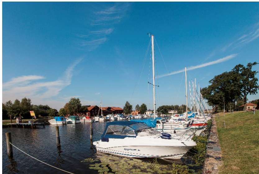
Fritidsbåtar i Inre hamnen

Styrelsen och nämnderna har totalt 20 internkontrollpunkter varav tre är kommungemensamma. Av dessa kontrollpunkter har fem kontrollerats under året, för resterande 15 punkter ska kontrollen genomföras under hösten.