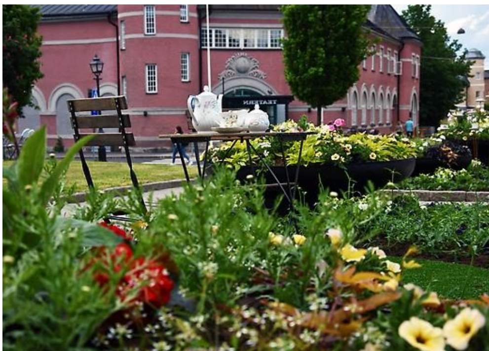
Årets tema för sommarblommorna är fika

Köpings kommun har tre utvecklingsmål som beslutades av kommunfullmäktige de 16 december 2019. Utvecklingsmålen är långsiktiga och sträcker sig från 2020 - 2027. Till varje mål finns en målsamordnare som leder arbetet. Under året har arbetet med att ta fram en handlingsplan för respektive utvecklingsmål påbörjats. I arbetet med handlingsplanen för respektive mål görs bland annat en analys av nuläget, våra styrkor, svagheter och möjligheter, omvärldsfaktorer, förslag på strategier, samt en prioritering av dessa.