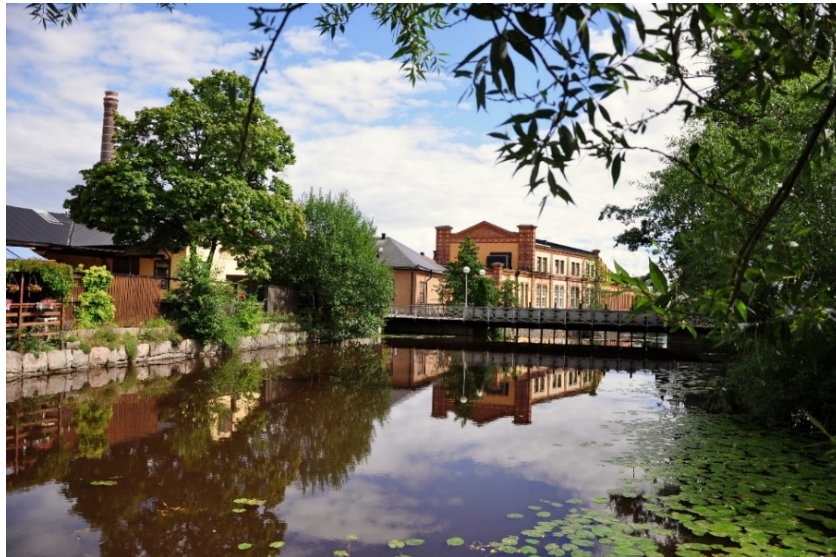
Köpingsån vid Damnbron

Under januari-augusti 2020 har anmälningar av tillbud och arbetsskador utan frånvaro minskat i jämförelse med samma period 2019. Dock har antalet anmälningar av arbetsskador med frånvaro ökat något mellan perioderna.