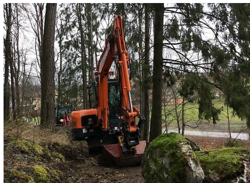
Grävmaskiner på plats vid Nyckelberget