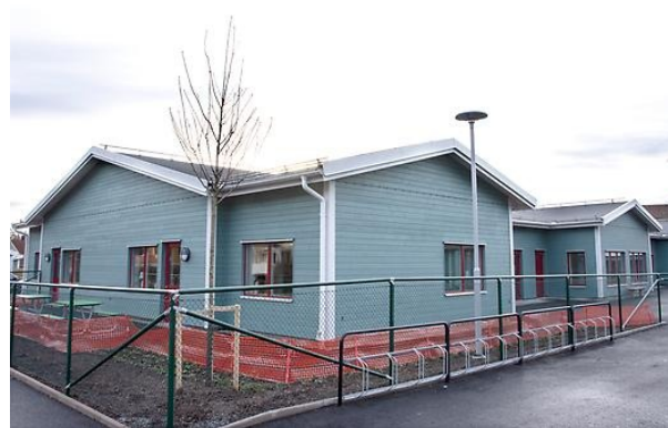
Förskolan Savannen i Kolsva har sex avdelningar och en stor gård med lekredskap runt nästan hela förskolan

De största avvikelserna ligger på larm/låssystem och investeringar i välfärdsteknik sammanlagt 5,3 Mkr, dessa investeringar kommer att fortsätta 2021. Tvätteriet har färdigställts under året med ett underskott på 2,1 Mkr. Detta kompenseras av övriga inventarier.